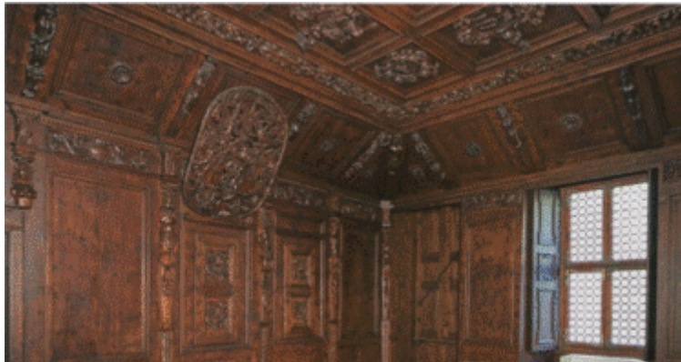
STUA SALIS, FINE XVII SECOLO- LEGNO INTAGLIATO

IN QUESTA OCCASIONE VENNE RISTRUTTURATO E DI CERTO NELLA SISTEMAZIONE DEL GRANDE GIARDINO FACENTE PARTE DELLA STRUTTURA, ATTUALMENTE ADIBITO A SPAZIO PUBBLICO, FU COINVOLTO PIETRO LIGARI.